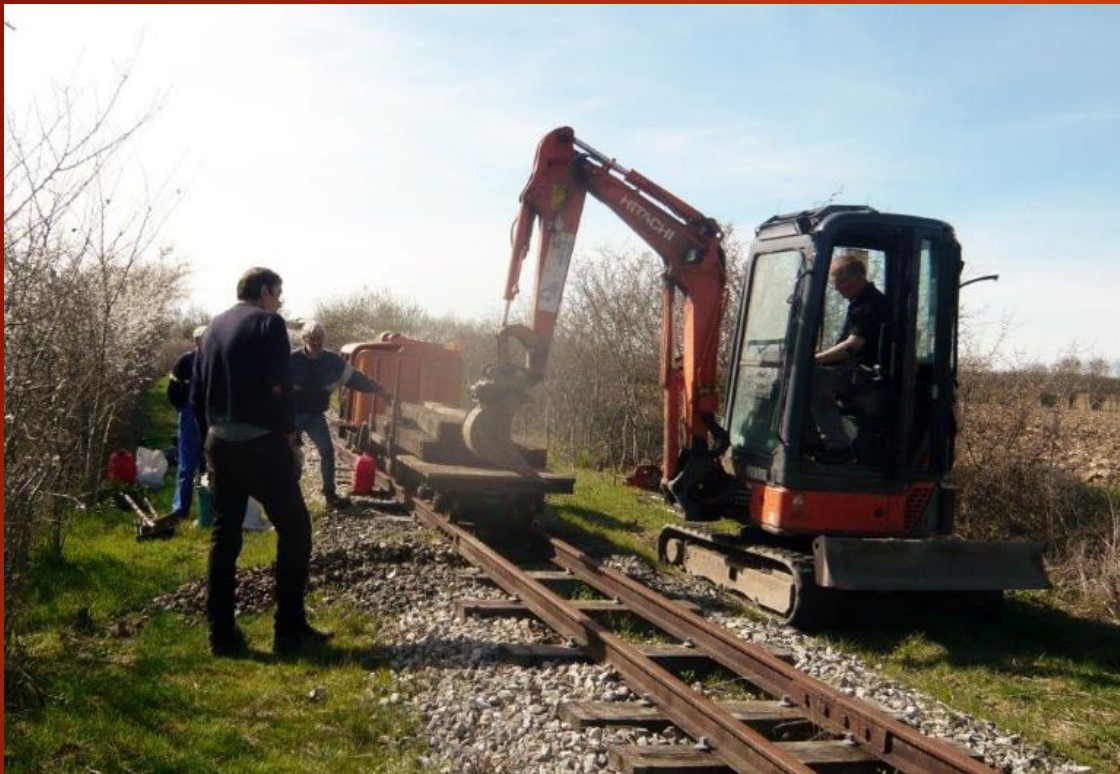
Chantier de préparation des "fondations"