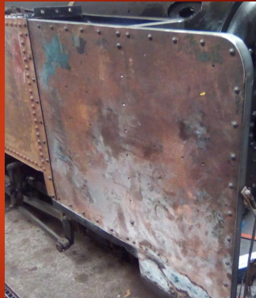
Tôle extérieur avec cornière de fixation neuve