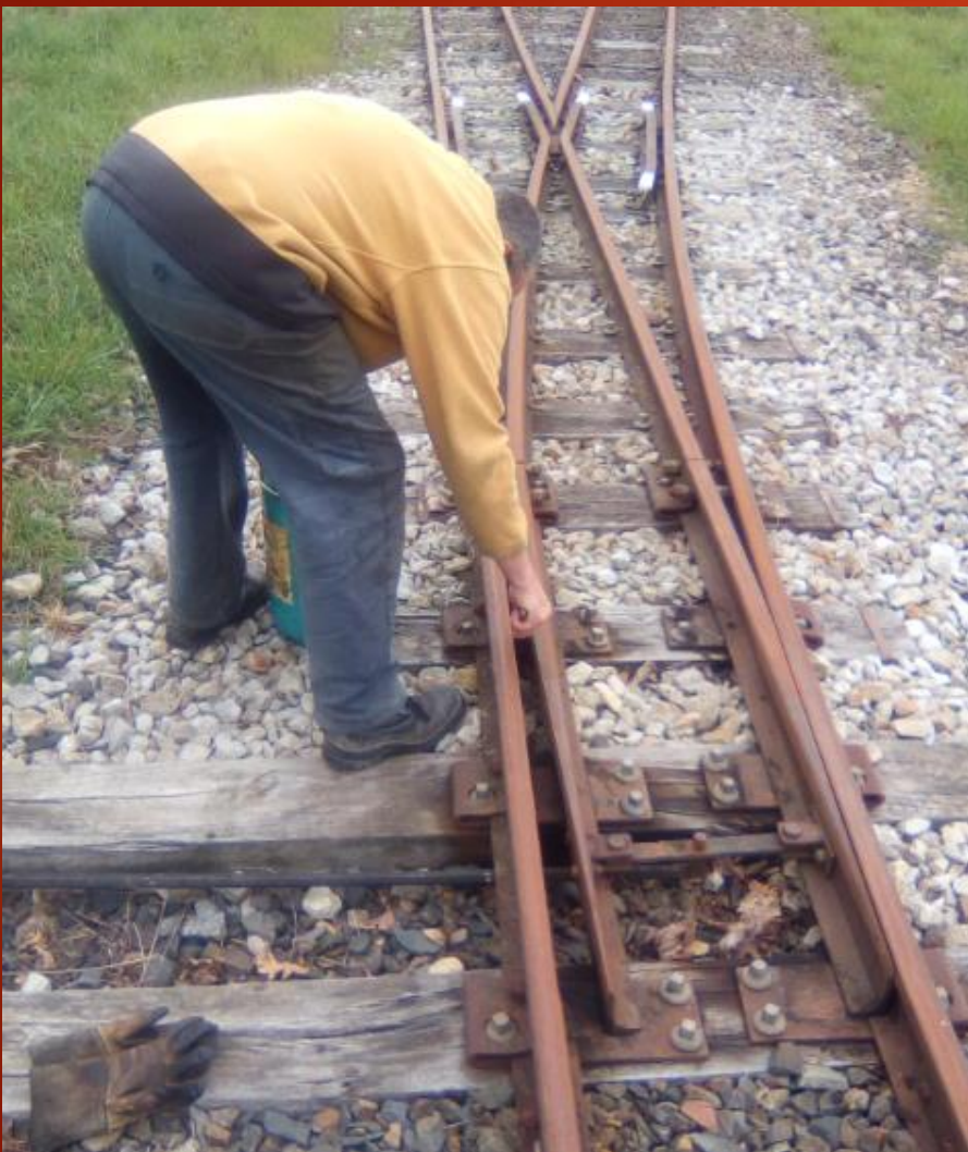
Graissage des aiguilles