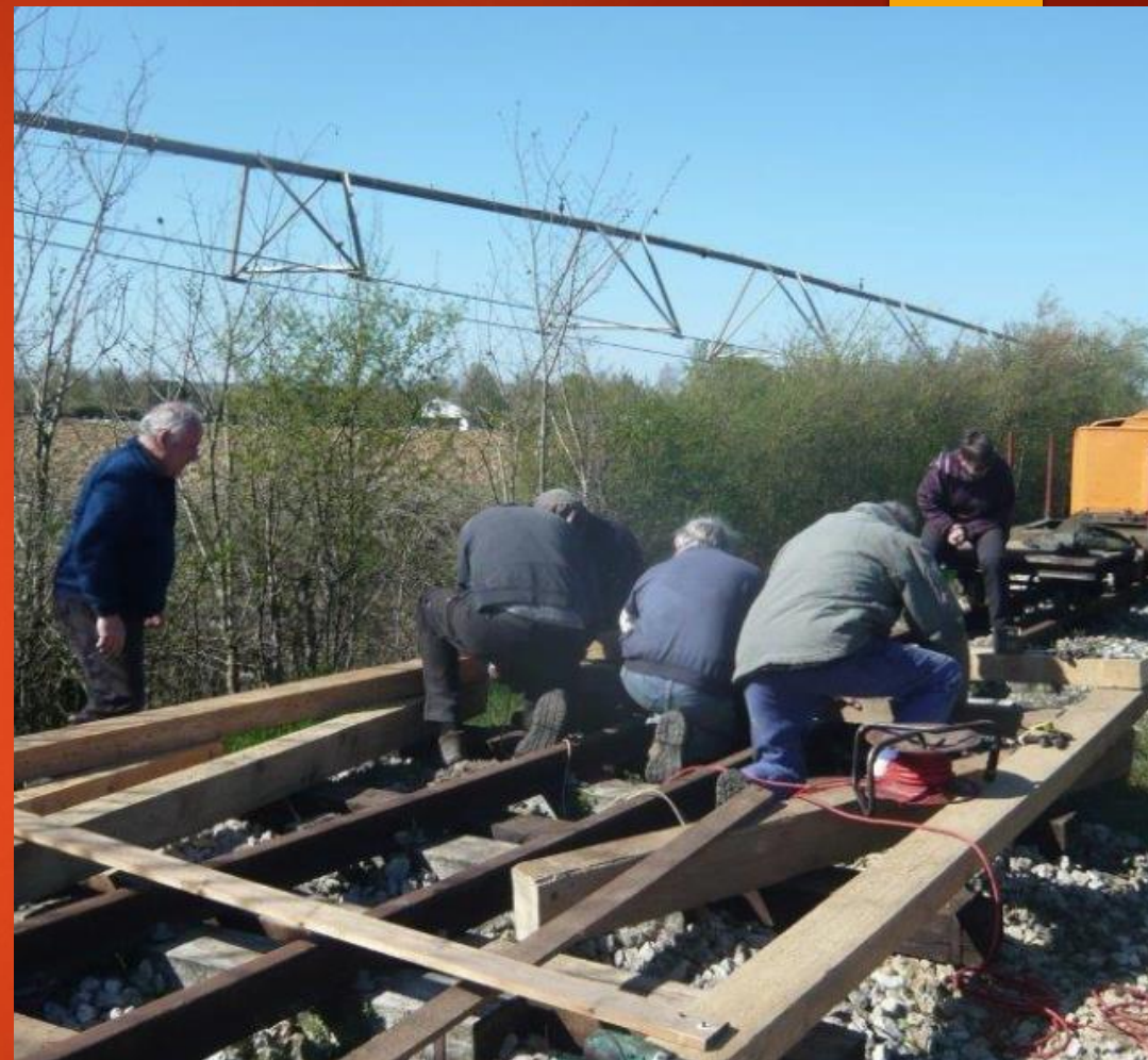
Mais que font ils tous penchés vers l'ouest ??