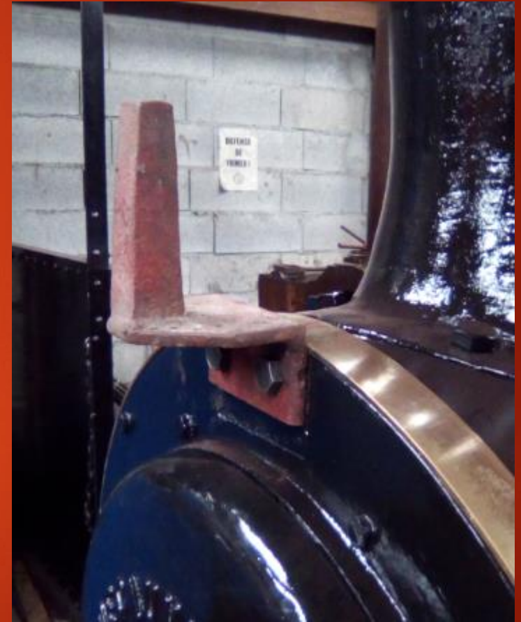
Porte lanterne fixé