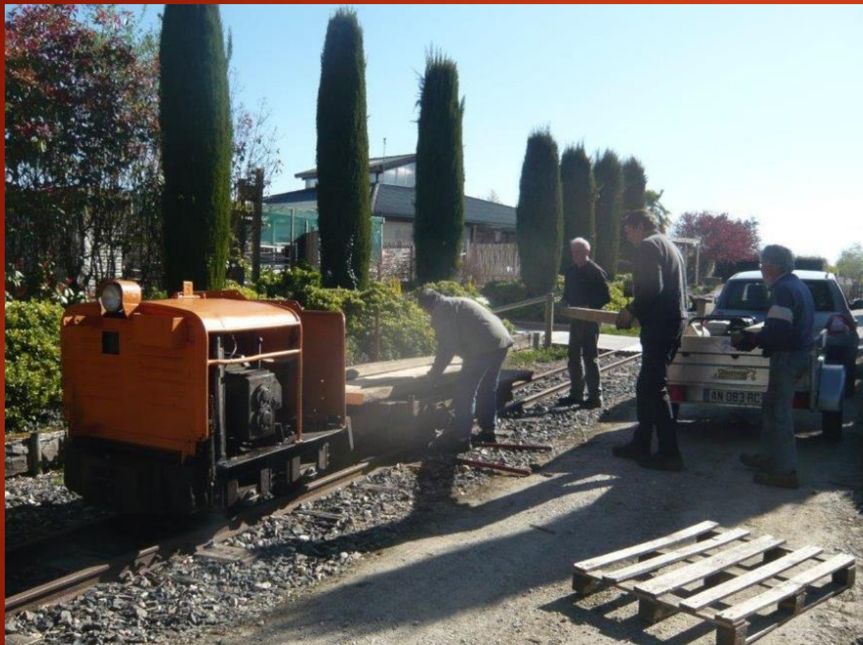
Approvisionnement route rail du chantier