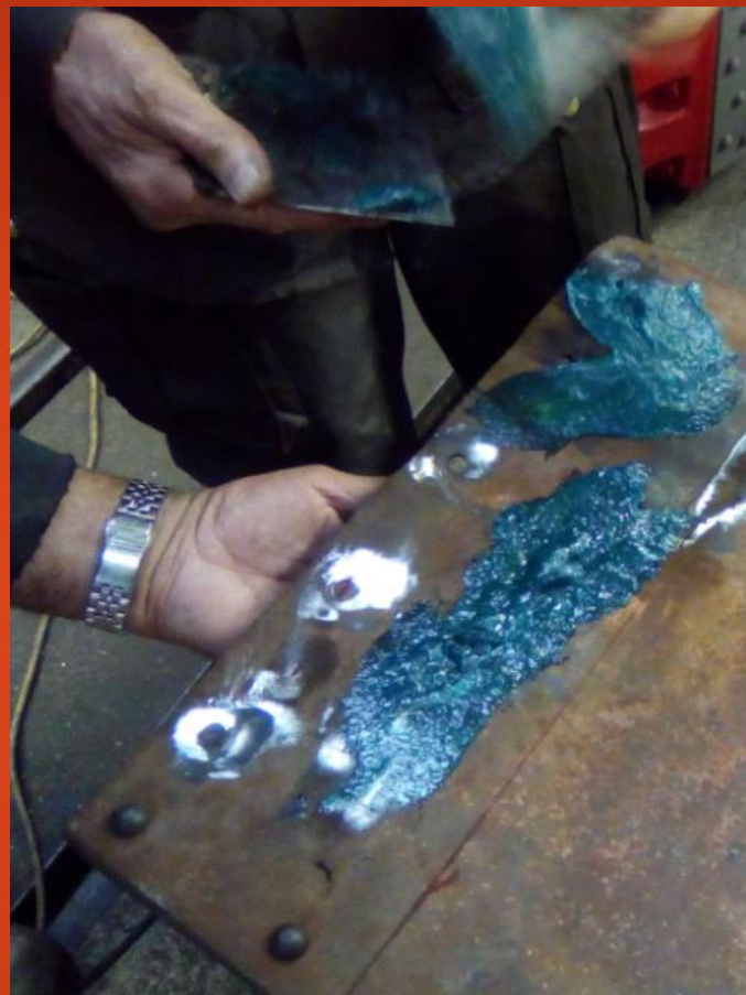
Reprise tôle extérieur