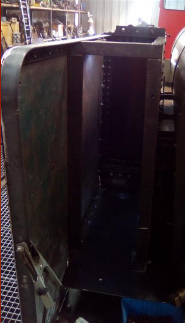
Soute à charbon: il ne manque plus que la tôle avant