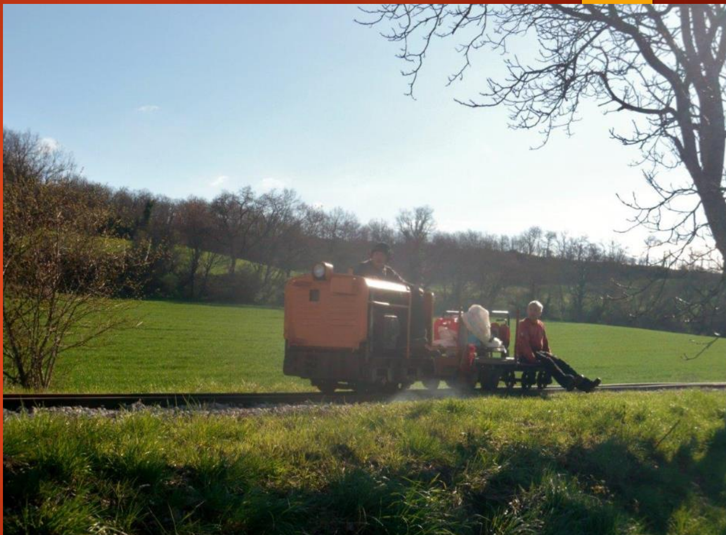
Dans la brume du Heim à Giroussens