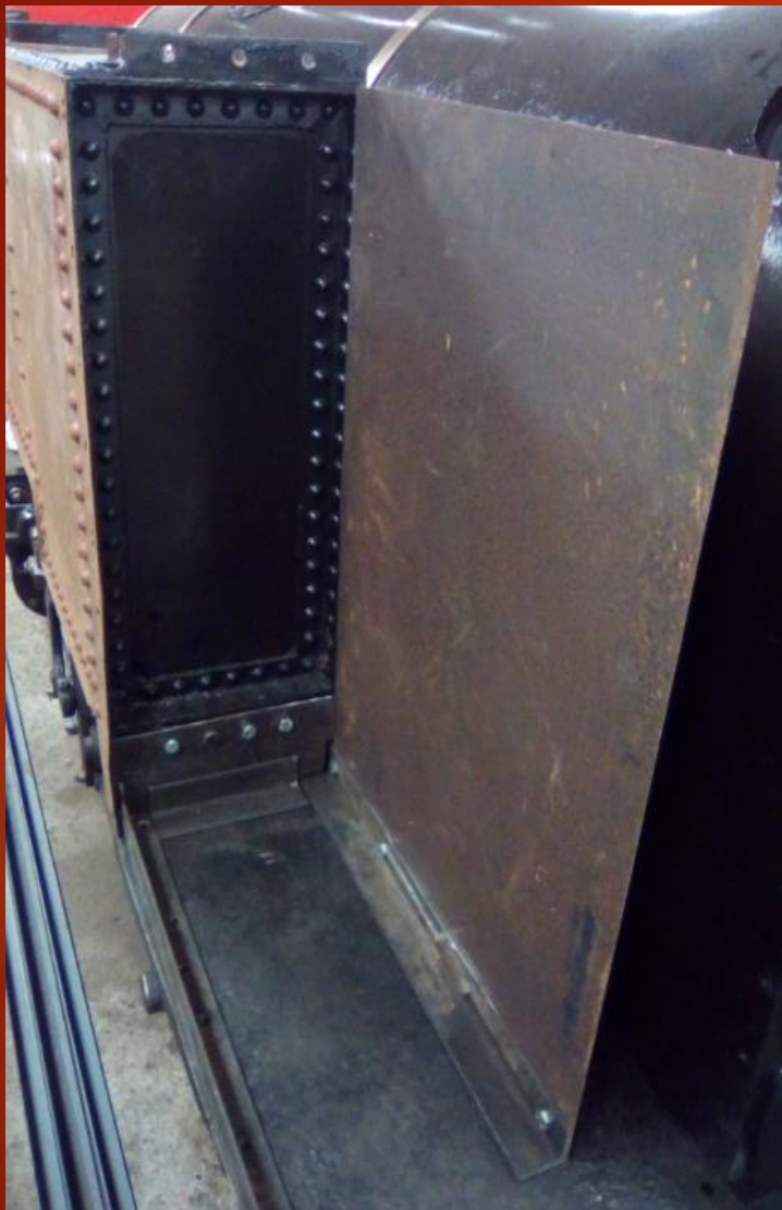
Nouvelle tôle intérieur